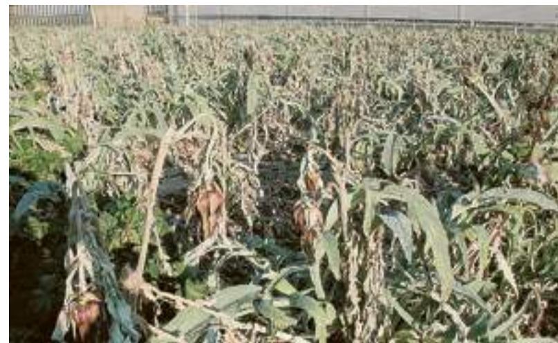
Un campo di carciofi gelati nella piana di Albenga