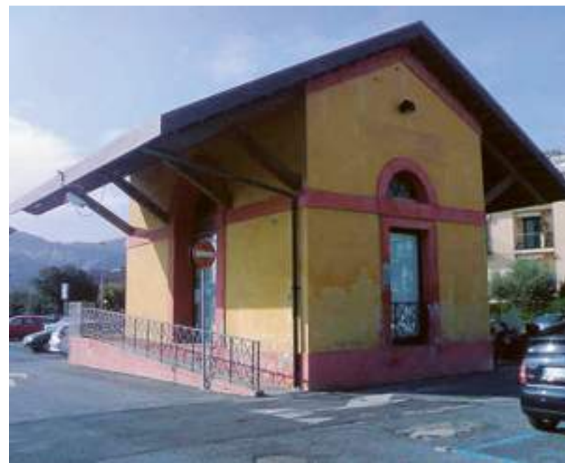
L'ex stazione ferroviaria in lungomare Montale che ospiterà l'info point